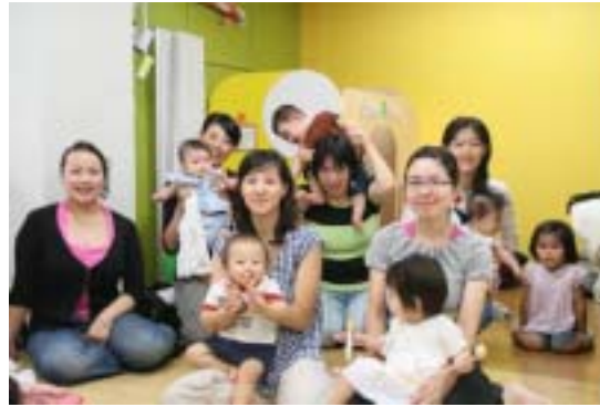
<編集タイアップ座談会>