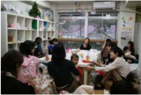
<グループインタビュー>